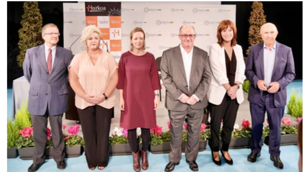
Ordezkaritza instituzional zabala izan zen Azkoitian Hurkoaren aurkezpenean.