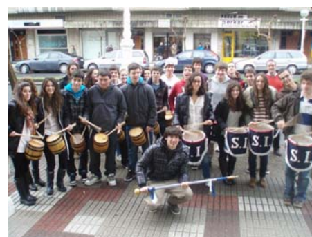
Tamborrada del Colegio San Ignacio