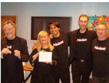
Grupo de Magia 'Amagos'