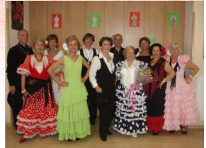
Grupo La Esperanza