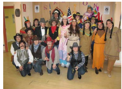
The Mercedes West Carnival