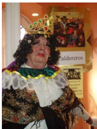
Reina de Caldereros