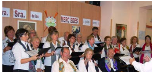
Coro Las Mercedes