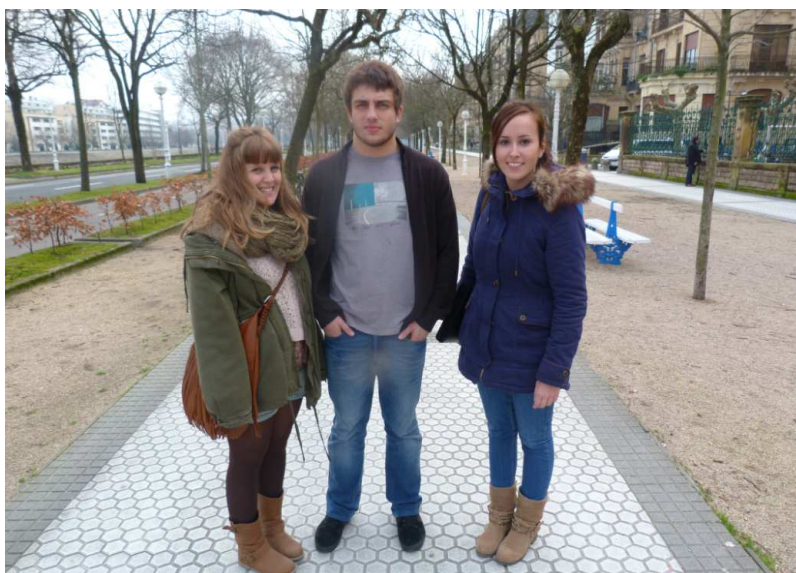
Alumnos en prácticas en el curso 2012-2013

De esta forma, continuó acogiendo a alumnos en prácticas de auxiliares de gerontología, de administrativo, alumnas de Deusto para la asignatura de Formación en Valores, personas adultas TBC, y menores con trabajos en beneficios de la comunidad, las visitas de otros Centros o Instituciones y, sobre todo, ayudas técnicas prestadas a la sociedad, como son la cesión de camas, sillas de ruedas, colchones anti-escaras, taca-tacas, muletas, grúas, etcétera.